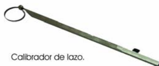
Calibrador de lazo.

Calibradores especiales para cerezas en aros y también disponibles en plataformas de bolsillo